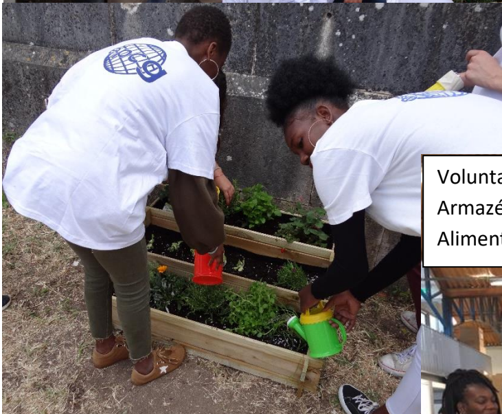
Voluntariado nos Armazéns do Banco Alimentar