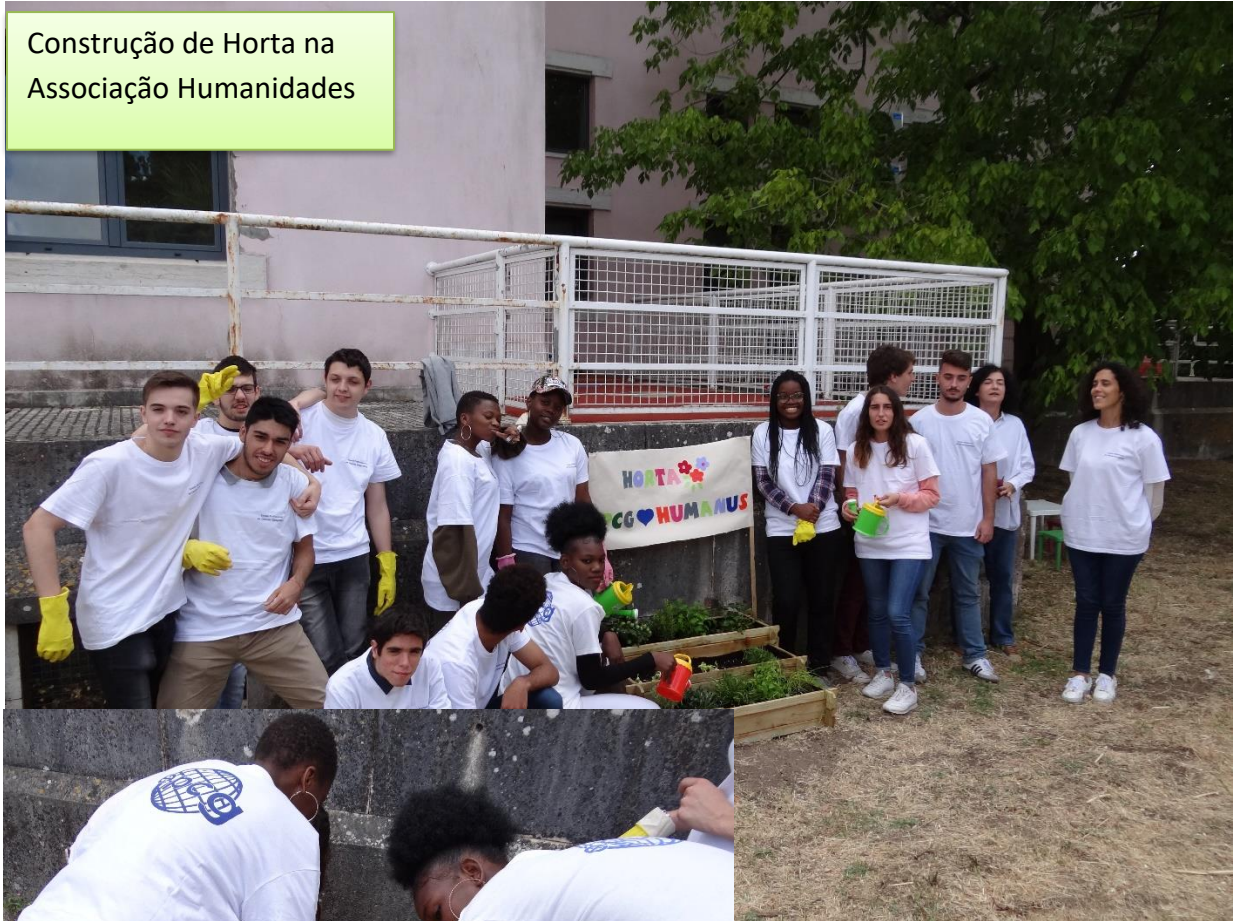
Construção de Horta na Associação Humanidades